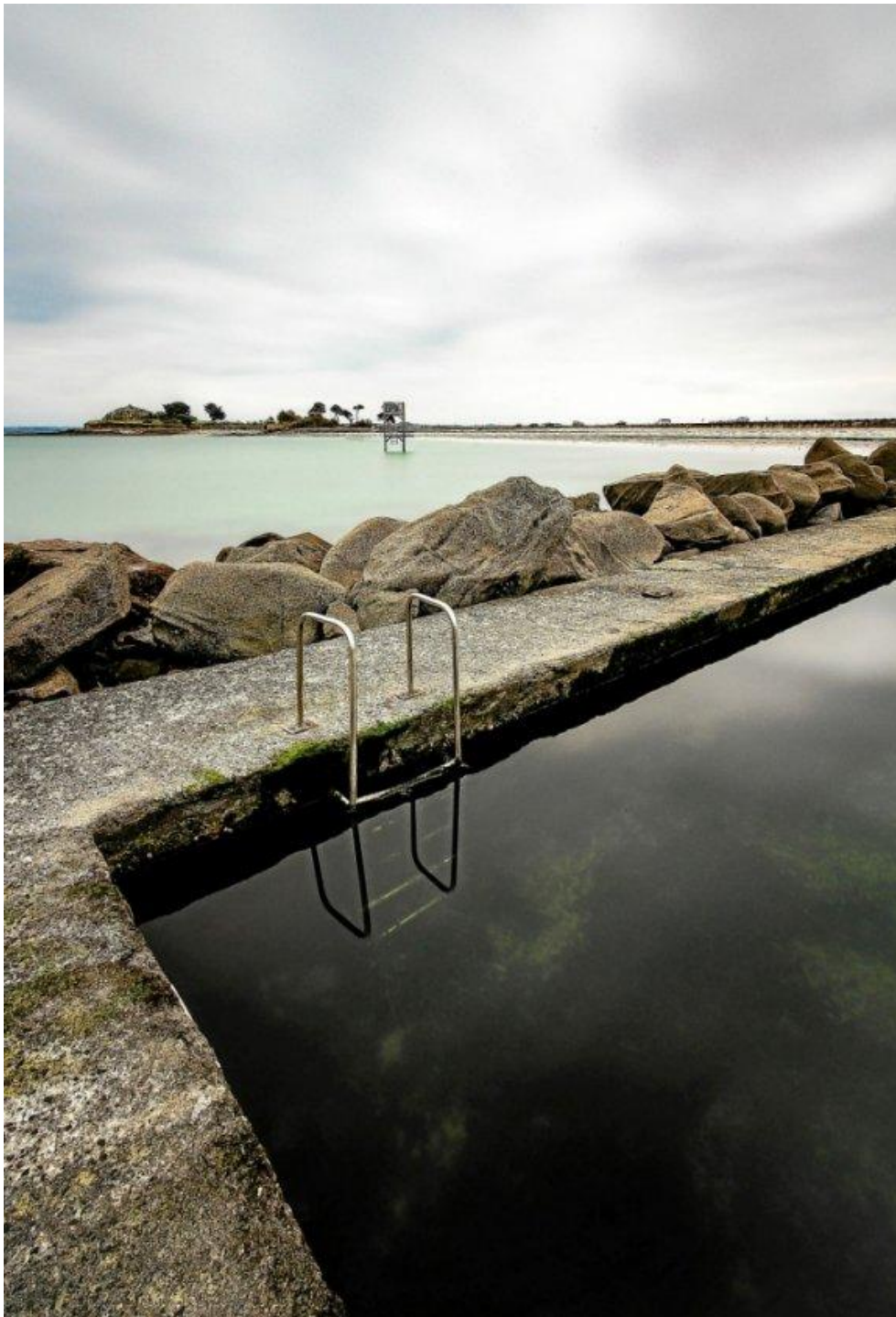
Le spectacle apaisé de la pataugeoire de plage Sainte-Anne à Saint-Pol-de-Léon a retenu l'attention du jury du club photo.

Réunions de bureau et ateliers en visioconférence sont désormais un rituel bien rodé, et, pour la troisième partie de saison, le programme s'enrichit de nouvelles thématiques (photos de rue, photos animalières) qui suscitent un bel engouement.